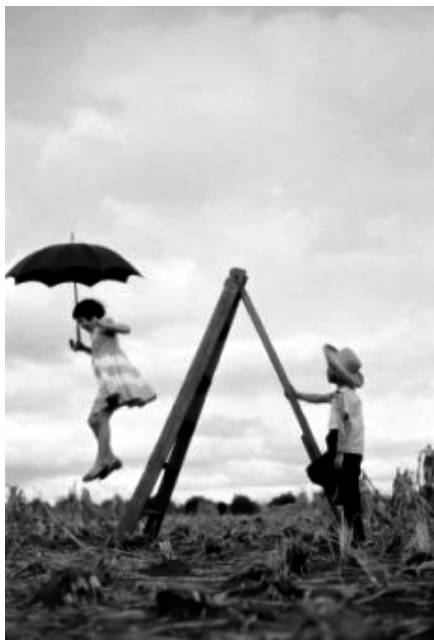
(OHARA, H. Jornal de Londrina , 9 nov. 2009, p.01)

A foto, feita pelo fotógrafo amador Haruo Ohara (1909-1999), registra a presença de duas crianças brincando em uma área rural. A menina empunha uma sombrinha e o garoto usa chapéu, o que sugere um dia de sol. As crianças não têm brinquedos e se divertem com o que encontram naquele momento. O garoto segura com firmeza a escada, demonstrando zelo e cuidado com a companheira de diversão.