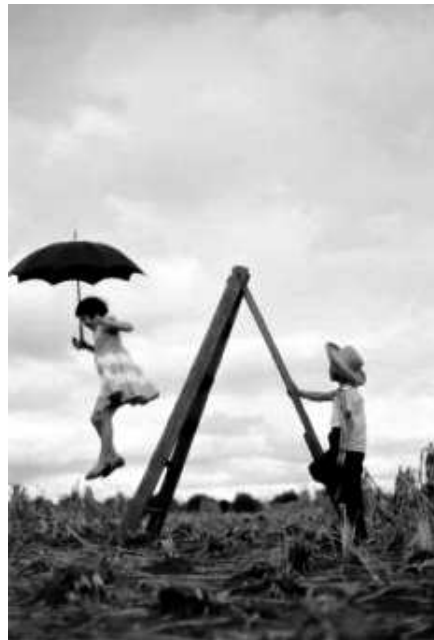
(OHARA, H. Jornal de Londrina , 9 nov. 2009, p. 01.)

A foto, feita pelo fotógrafo amador Haruo Ohara (1909-1999), registra a presença de duas crianças brincando em uma área rural. A menina empunha uma sombrinha e o garoto usa um chapéu, o que sugere um dia de sol. As crianças não têm brinquedos e se divertem com o que encontram naquele momento. O garoto segura com firmeza a escada, demonstrando zelo e cuidado com a companheira de diversão.