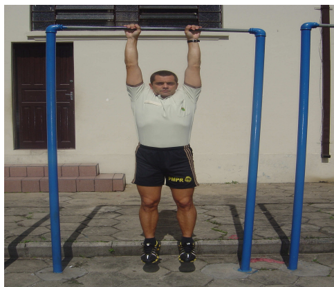
Figura 2 - Posição 1 (inicial) e Posição 3 (final)