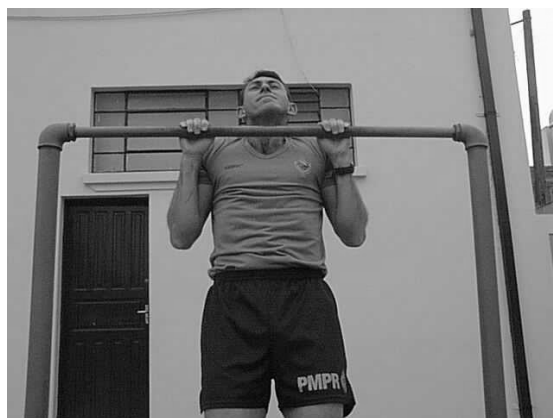
Figura 02 Posição 2 Intermediária.