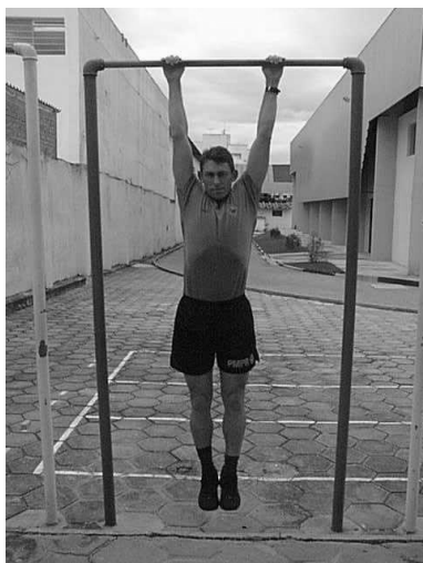
Figura 01 Posição 1 Inicial

d) Número de repetições: Livre a critério do candidato(a). Os pontos serão computados conforme a tabela.