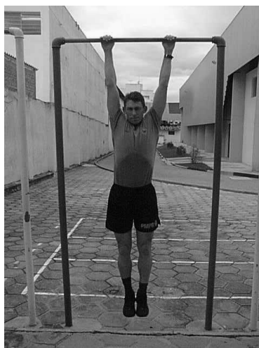
Figura 03 Posição 3 Final do Exercício